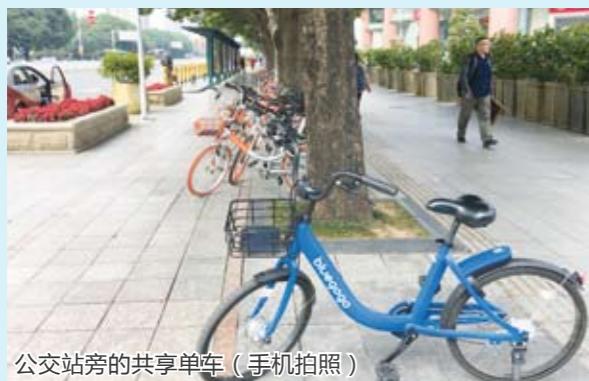
公交站旁的共享单车（手机拍照）

何为共享单车？与普通单车有何区别？这个最新行业的领先者摩拜单车（mobike）在官网上如是介绍：是一种无桩借、还车模式的智能硬件。人们用智能手机（通过互联网）就能快速租用和归还一辆摩拜单车，用可负担的价格来完成一次几公里的市内骑行。摩拜单车的创始人胡玮炜，是一位汽车科技领域的年轻记者。她做摩拜单车的原因在于：（一）对国内外公共单车的痛点深有体会：想骑路边紧锁的公共单车，却不知到哪里办手续；（二）在奔驰中国设计中心工作的朋友跟她说，未来的个性出行工具有会有一波革新潮流；（三）有人投资她做共享出行项目。摩拜单车的创业之路，引来了多家风投及互联网企业