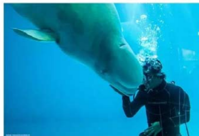
深圳市盐田区小梅沙海滨旅游度假区 WWW.SZXMS.COM.CN 0755-25035556